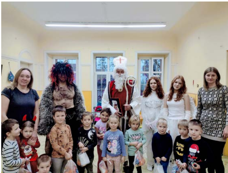
Čert, Mikuláš a andělé ve třídě Lodička.

Teď už se jen budeme těšit, co nám nový rok ukáže ve školce a kolik legrace si ještě užijeme. Doufáme, že už konečně se sněhem a ne na blátě.