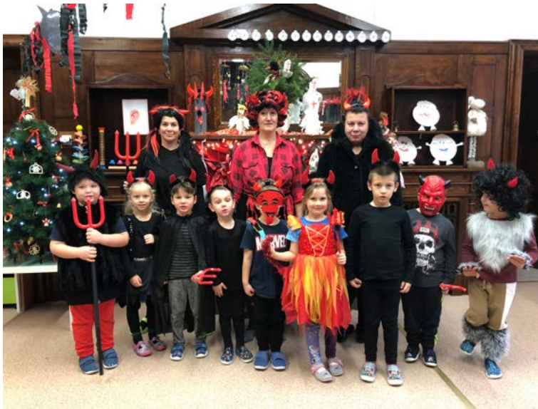
Čertí školka v Autíčku.