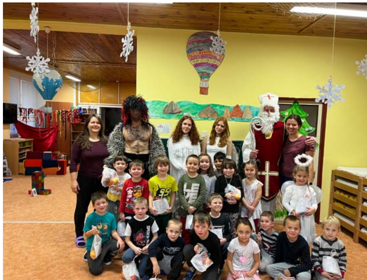
Mikulášská nadílka v Balonu.