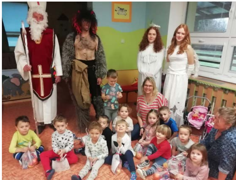
Čertí návštěva v Mašince.