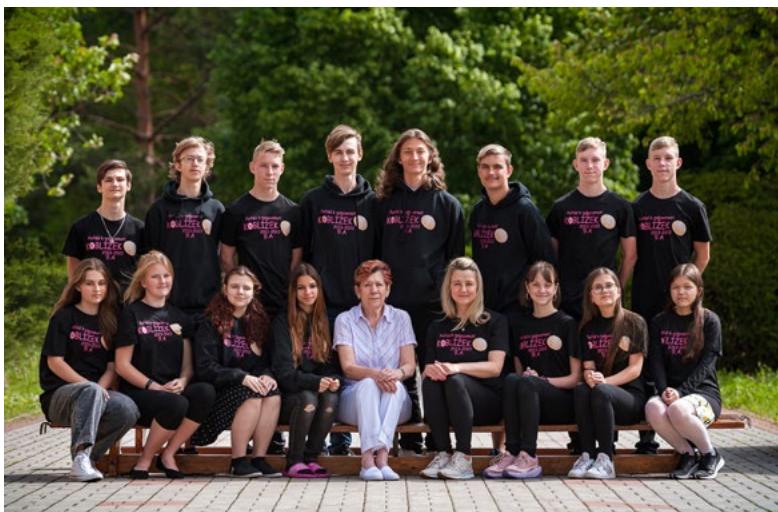
Základní škola Hrádek 9. A Školní rok 2021/2022

V úterý 29. června odpoledne se uskutečnilo v domě kultury slavnostní rozloučení se žáky devátých tříd hrádecké základní školy. Mnoho štěstí a studijních úspěchů na jejich další cestě životem jim přejí všichni pedagogové, vedení školy a město Hrádek.