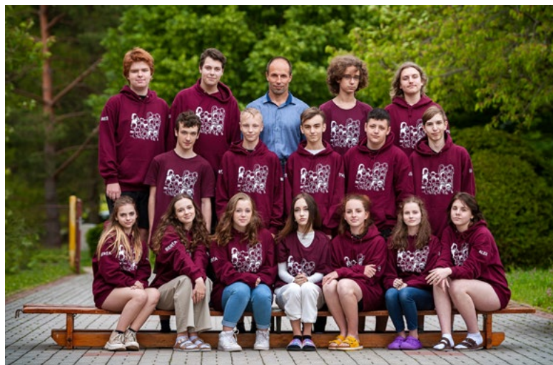
Základní škola Hrádek 9. B Školní rok 2021/2022