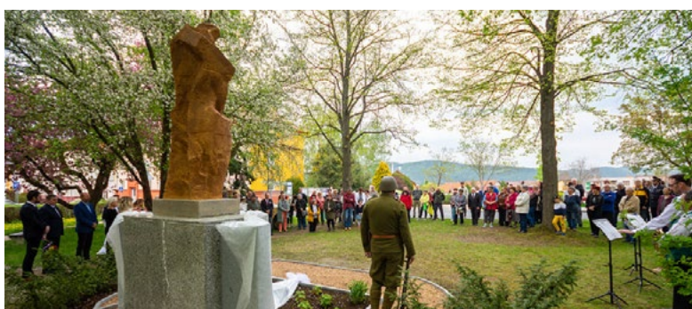
Opravili jsme pomník padlým a umučeným během 1. a 2. světové války.