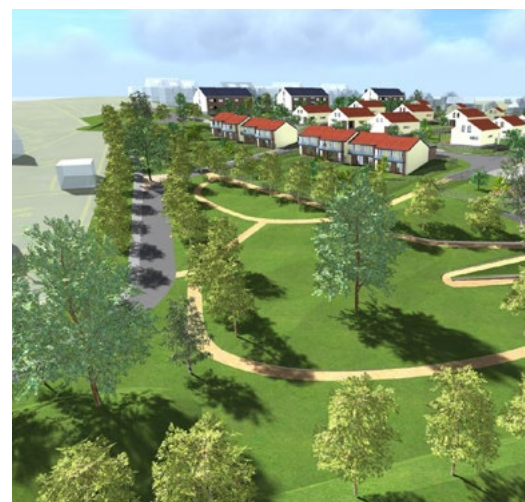
Vykoupili jsme většinu pozemků pro realizaci výstavby v lokalitě Hrádek střed II a připravili k projednávání studii možné podoby zastavění.