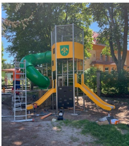
Instalovali jsme každý rok nové herní prvky na dětská hřiště.