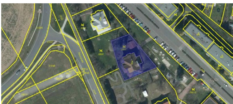
Koupili jsme vilu č.p. 38 a zahájili její rekonstrukci a přestavbu na lékařský dům.