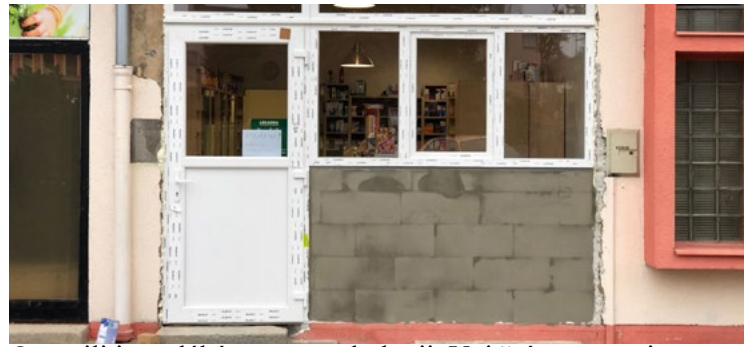
Opravili jsme lékárnu a gynekologii. Vnitřní prostory jsme vybavili klimatizací.