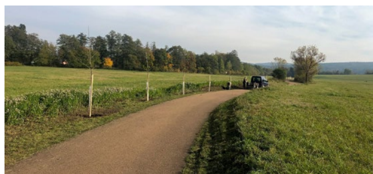
Podařilo se nám získat dotaci na výsadbu stromů v Hrádku.