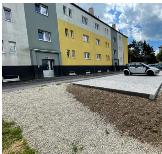
Rozšiřujeme počty parkovacích míst v sídlišti.