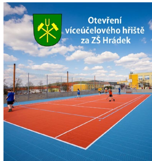
Výbudovali jsme za více než 2 mil. Kč nové víceúčelové hřiště pro školní děti i veřejnost.