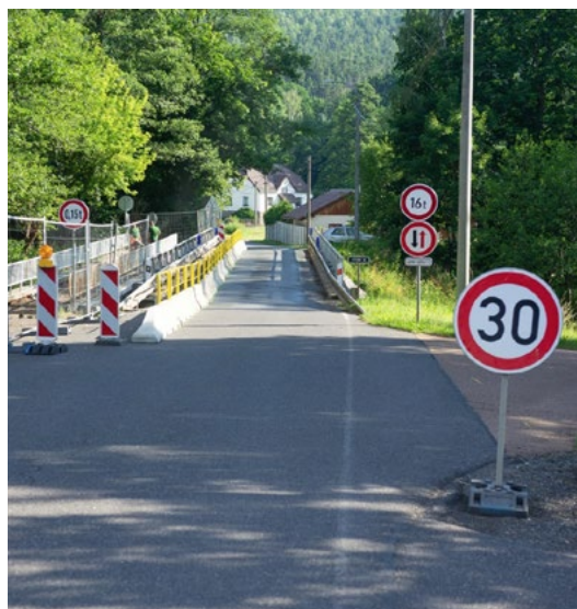
Za cca 9 mil Kč rekonstruujeme lávku v ulici Hutnická.