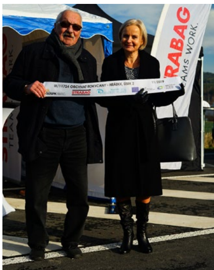
Otevírali jsme obchvat města včetně městem zbudovaného chodníku k bývalému kravínu.